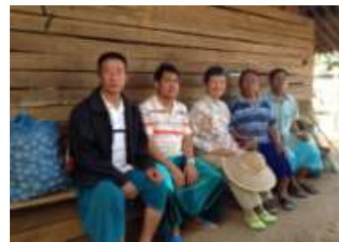
(ข) ชาวเผ่าลีซอในหมู่บ้านเฮโก ซึ่งตั้งถิ่นฐานมาก่อนอดีตทหารจีนคณะชาติจะย้ายมาอยู่บนดอยแม่สลอง