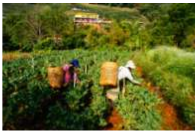
(ก) วิธีการผลิตแบบเกษตรกรรมแบบยังชีพ