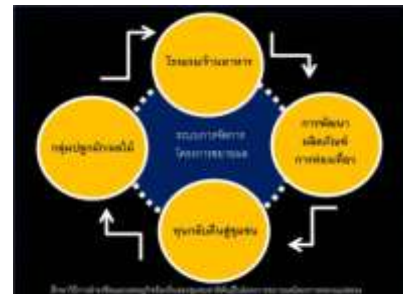
(ง) ระบบความสัมพันธ์ทางการผลิตในพื้นที่โครงการขยายผลโครงการหลวงแม่สลอง

ภาพการศึกษาของค้ความรู้ ภูมิปัญญาท้องถิ่น และวิถีชีวิตของชุมชนในพื้นที่ขยายผลโครงการหลวงแม่สลอง