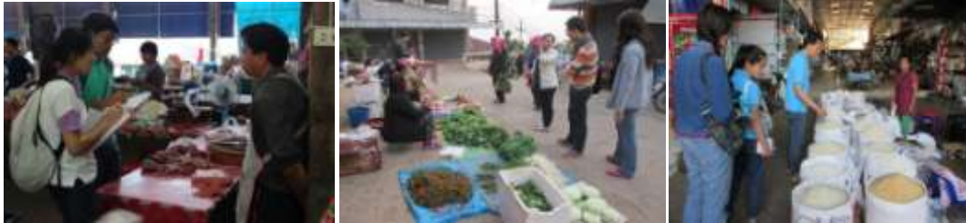
ภาพที่ 39 การศึกษาความต้องการสินค้าเกษตรของชุมชน

8. การสร้างการเกษตรให้กลายเป็นสถาบัน ด้วยการสร้างให้สินค้าเหล่านั้นได้รับการยอมรับในระดับต่างๆ เช่น การนำไปประกวดผลิตผลทางการเกษตรทั้งระดับชาติ และระดับนานาชาติ รวมถึงการสร้างสมาคมทางการค้า สมาคมทางการเกษตรที่เชื่อมโยงกับเครือข่ายระหว่างประเทศ ซึ่งดอยแม่สลองมีความได้เปรียบที่สามารถเชื่อมโยงกับเครือข่ายต่างประเทศได้ผ่านทางจีนแผ่นดินใหญ่และไต้หวัน