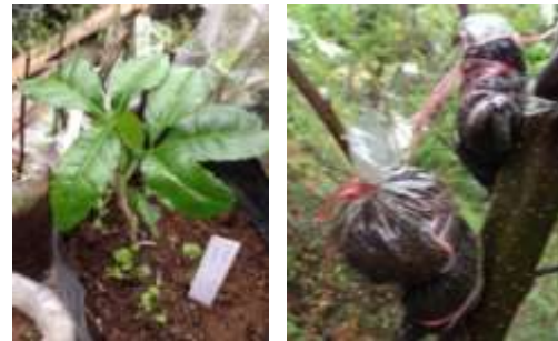
(ง) การขยายพันธุ์พืชสมุนไพรที่สำคัญ

ภาพการต่อยอดองค์ความรู้และสร้างมูลค่าเพิ่มจากพืชสมุนไพรและยาพื้นบ้านในชุมชน