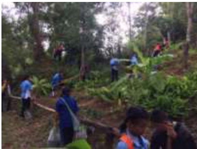
(ค) การปลูกฟื้นฟูพืชสมุนไพร