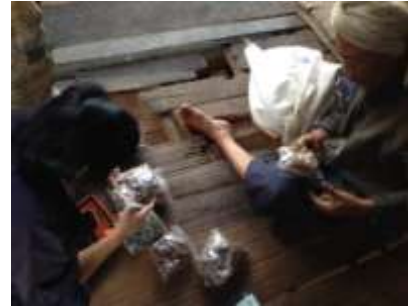
(ข) การศึกษาและคัดเลือกสมุนไพรท้องถิ่นและยาพื้นบ้านที่มีศักยภาพใช้ประโยชน์