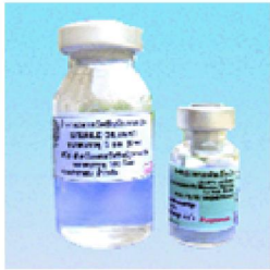
นิวคาสเซิล