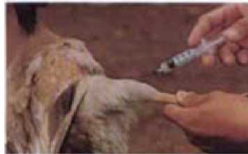
ฉีดเข้ากล้ามเนื้อ