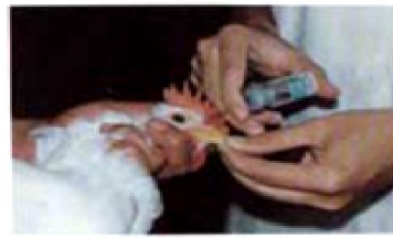
หยอดจมูก